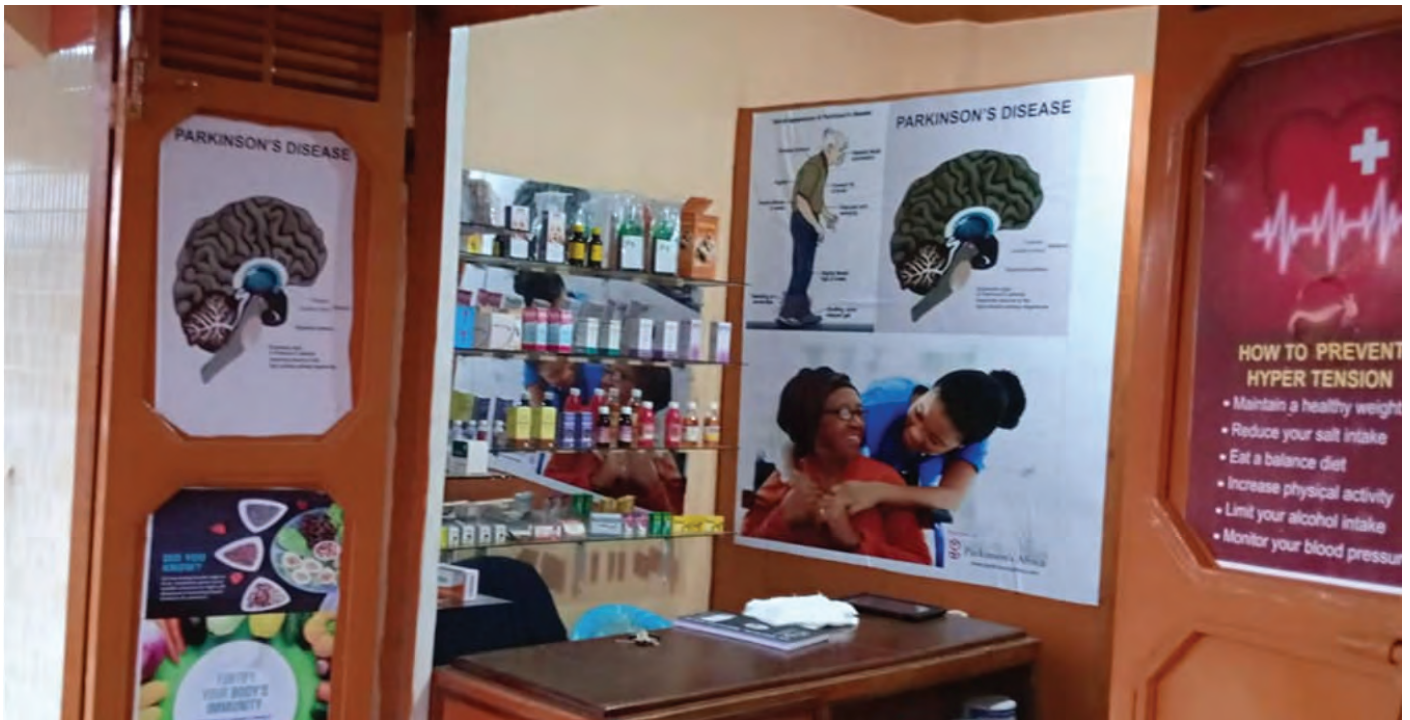
Parkinson's Si Buko Ụ́lọ ọ́gwụ́ ahụike Parkinson na Uganda

Ọ́ na-emetụtakarị akụkụ ụ́bụrụ nke na-ahụ maka ichikwa mmegharị ahụ. Mpaghara ụ́bụrụ a metụtara na-ekerekwa òkè na ọ́rụ ndị ọ́zọ dị mkpa dị ka mmụta, omume, ụ́ra, mgbu na ncheta. Ọ́rịa Parkinson nwekwara ike imetụta akụkụ ahụ ndị ọ́zọ dịka afọ, ọkpụkpụ na anya.