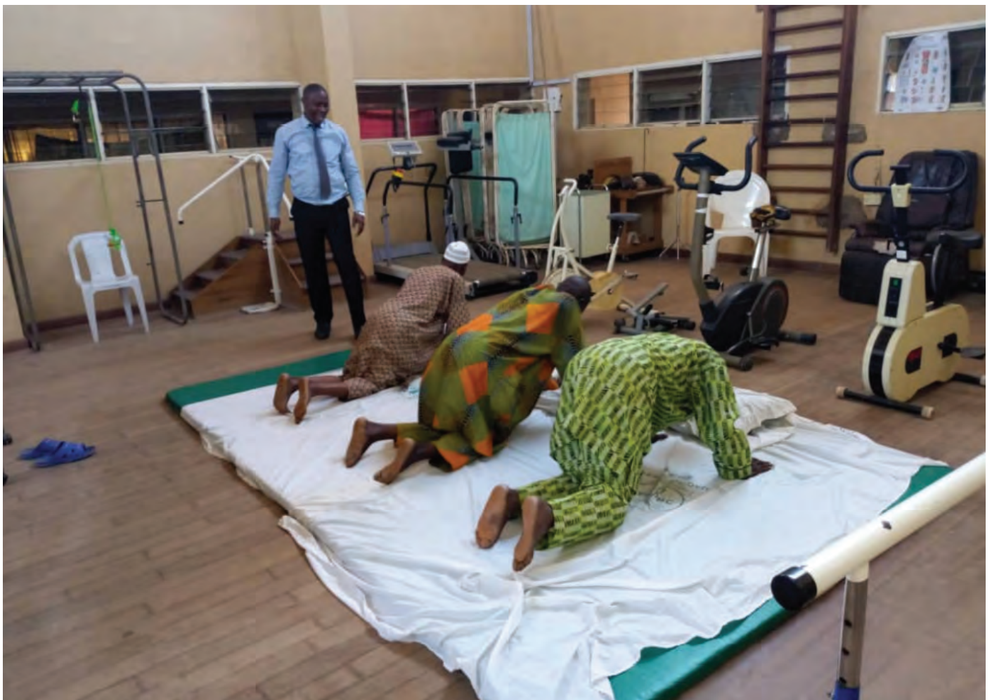
Otu nkwado Parkinson OAUTHC, Ile-Ife, Nigeria

Ụzọ kacha mma isi jikwaa ọrịa Parkinson gụnyere nchikota ọgwụ, ọgwụgwọ na ụdị ndụ ahụike - nke gụnyere imega ahụ mgbe nile, iri ezigbo nri na nri kwesiri ekwesị, hụ na enwere ezigbo ụra nke ọma na ibelata nrugide. Ụfọdụ mgbaàmà ka mma ilekwasi mgbaàmà ahu we nye ya ọgwụgwọ site na ọgwụgwọ ezubere iche, dịka ọmụmaatụ, ọgwụgwọ okwu na asụsụ maka okwu ma ọ bụ ihe isi ike ilo, na-kwa onye na ahu maka akwara siri ike, nguzozi na egwu ịda ada.