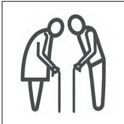
Ije nwayọ nwayọ