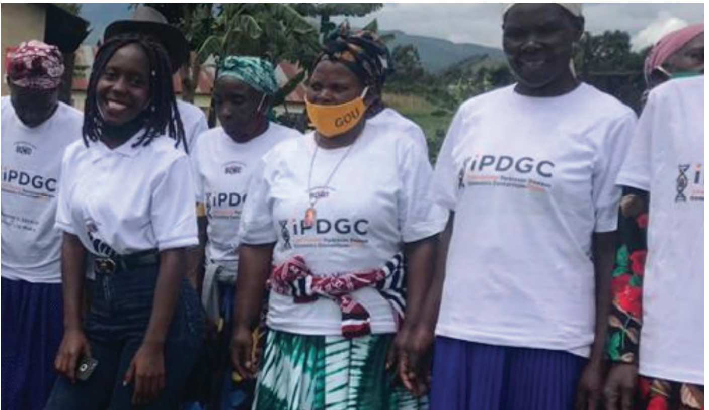
Parkinson's Si Buko, Uganda

Anyị maara na anyị enweghị ike ịga ebe dị anya naanị anyị, yabụ anyị na-arịọ gị ka ị sonyere anyị ka anyị na-ewu ma gbasaa obodo a. Biko gaa na www.parkinsonsafrica.org maka ozi ndị ọzọ ka ị ga-esi sonyere anyị.