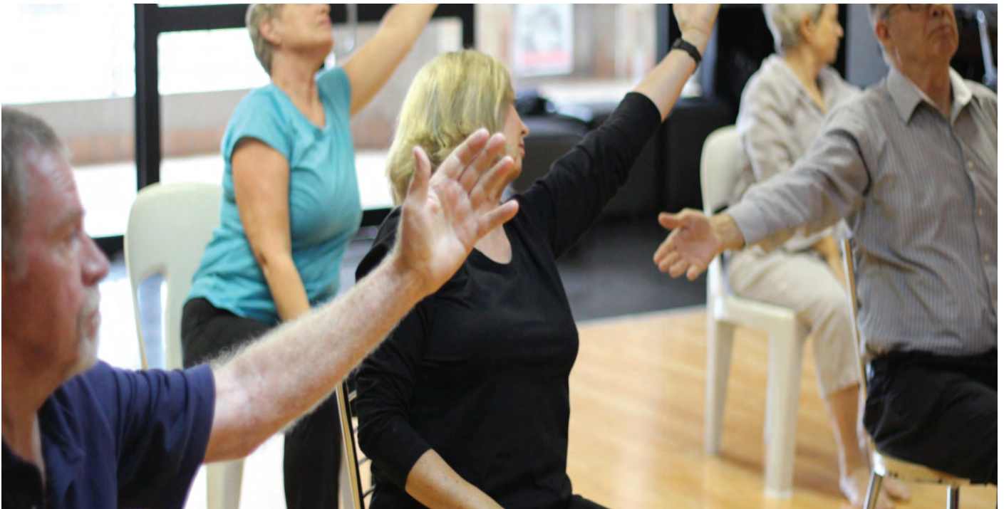
Ebe nkuzi mgbatị ahụ dabere na oche Nkwado Parkinson, Constantia Park, South Africa

Dị ka ọ di na nri kwesiri ekwesị, mmega ahụ bụ akụkụ di mkpa maka ọdịmma onye ọ bụla. Otú ọ di, na ọrịa Parkinson, mmega ahụ di mkpa karisịa. Mgbe ọfọdụ, mgbaàmà di ka mkpogide na mgbaàmà ndi di ka enweghi mmasi, mgbu, ma ọ bụ ike ọgwụgwụ nwere ike ikuda gi ọbuna igbali imega ahụ. Otú ọ di, ọ di ezigbo mkpa ka i ghota na mgbe a biara n'ichikwa mgbaàmà gi, mmega ahụ di oke mkpa di ka ọgwụ ma nwee ike inye aka mee ka ọra di kwuo mma, meziwanye afọ ntachi ma ọ bụ nsogbu na ọfọdụ, ma belata ahụ erughi ala site na mgbu na mgbaàmà ndi ọzọ na-emetuta njem. Nnyocha na-egosi na ime mmega ahụ awa abuo na okara (awa 2.5) kwa izu nwere ike ime ka mgbaàmà gi di kwuo mma ma mee ka ọganihu gi kwusilata. Ọzokwa, mmega ahụ mgbe nile na-enyere gi aka inagide ọfọdụ mmetuta di n'akụkụ nke ọgwụ gi.