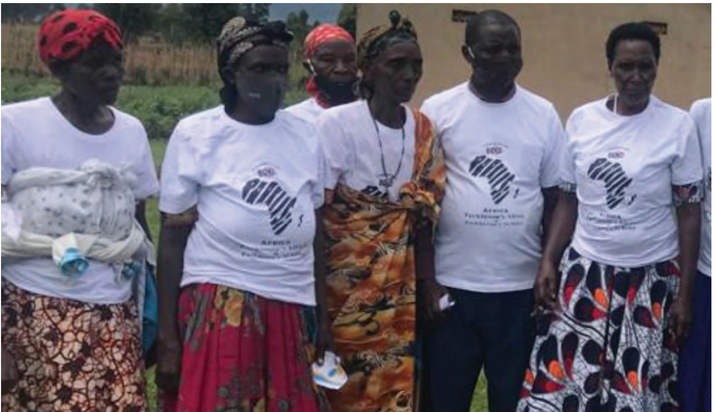
Parkinson's Si Buko, Uganda

Anyị nọ n'ọrụ iji nye obodo ọrịa Parkinson nke Africa ike, mana anyị enweghị ike ime ya naanị sọ anyị, anyị chọrọ gị! Ma a chọputara na ị nwere ọrịa Parkinson, ma ọ bụ na ị maara onye (enyi, onye ọrụ ibe, onye agbata obi, onye ikwu) onye ọrịa Parkinson metụtara ndụ ya, ma ọ bụ na ị bụ ọkachamara ahụike na-ahụ ndị na-arịa ọrịa Parkinson, anyị were gị dị ka akụkụ dị mkpa nke obodo a.