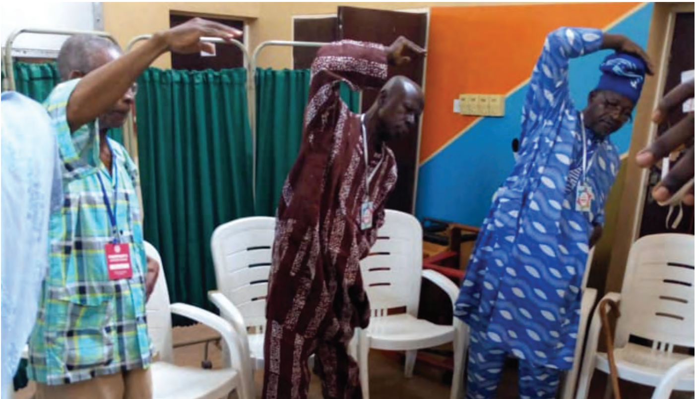
Otu nkwardo Parkinson OAUTHC, Ile-Ife, Nigeria

Enweghi mmega ahụ di mma maka onye o bula. I kwesiri ilekwasi anya n'ihe omume ndi na-amasi gi ma nwee ike ime. Enwere otutu mmemme di iche iche i nwere ike ime iji nogide na-emega ahụ. Dabere na mgbaàmà gi na ikike ahụ gi, i nwere ike ime mmega ahụ nke chorọ mgbalị ụfọdụ di ka ije ije ngwa ngwa, igba ígwè, igwu mmiri, igba ọsọ, ikụ ọkpọ n'ikuku, igba égwú, ibuli ihe elu, iwufe ụdọ, ma o bu ibuli ibu.